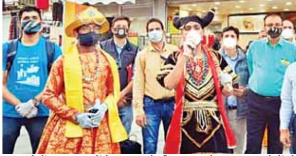
राजधानी में कुछ कलाकारों ने यमराज और विघ्नगुल का वेश धारण कर लोगों को कोरोना से सजग रहने का संदेश दिया।

इससे कुल संक्रमितों की संख्या बढ़कर 1,91,246 हो गई है। वहीं 11 लोगों की कोरोना से मौत होने के कारण मरने वालों की संख्या 3149 हो गई है। प्रदेश में जिस