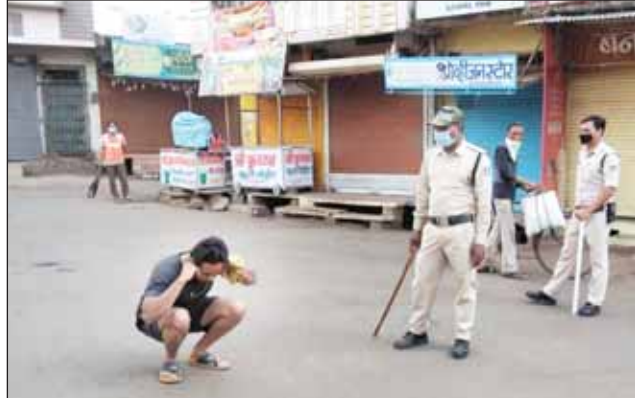
गुना। लॉक डाउन के दौरान मॉर्निंग वॉक पर निकलने की कुछ ऐसे मिली सजा