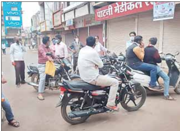
गुना। लॉकडाउन के दौरान बुधवार को लोग मास्क-सेनेटाइजर और दवाइयां लेने भटकते रहे। मेडीकल स्टोर बंद देखकर परेशान हो रहे लोग।

14 अप्रैल तक लॉकडाउन की घोषणा होते ही लोग मंगलवार की बीती शाम सामान लेने के लिए दुकानों पर टूट पड़े। उतावलेपन और घबराहट के बीच लोगों द्वारा प्रचुर मात्रा में सामग्री की खरीदी के दौरान कई दुकानदार बेईमानी पर भी उतर आए। इन दुकानदारों ने बेबस ग्राहकों से द्र से ज्यादा कीमत में सामान बेच डाला। इसे रोकना जनहित में होगा।