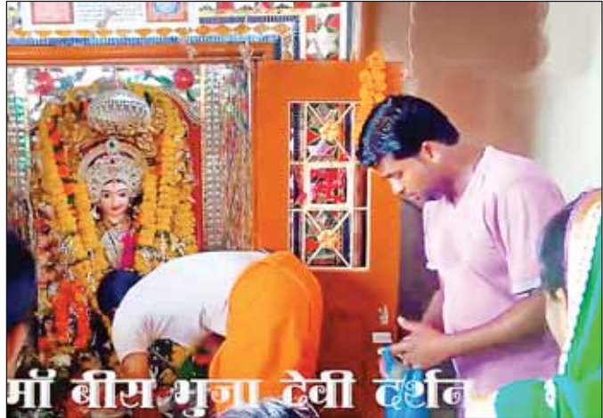
गुड़ी पड़वा ही सृष्टि की उत्पत्ति का दिवस माना जाता है। इस दिन भगवान भास्कर की आराधना का विशेष महत्व है जो वैज्ञानिक गणना पर आधारित है। विश्व

जागरण, गुना। अंचल में चैत्र नवरात्र का शुभारंभ बुधवार को नवसंवत्सर महोत्सव पर घर-घर में भगवान भास्कर को अर्घ्य देकर एवं सूर्य नमस्कार के साथ हुआ। यह पहला अवसर है कि जब शक्ति उपासक और मां दुर्गा के भक्त कोरोना वायरस के संक्रमण से निपटने लॉकडाउन के कारण बंद मंदिरों, शक्तिपीठों तक नहीं पहुंच पाए। श्रद्धालुओं ने हालात से समझौता करते हुए अपने घरों पर ही शक्ति की उपासना प्रारंभ की।