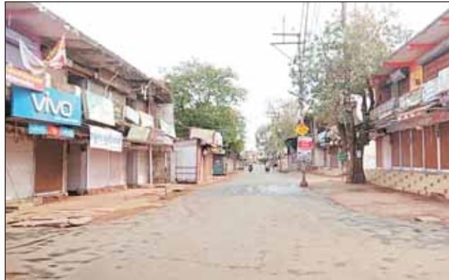
गुना। हर दिन व्यस्त रहने वाले सुगन चौराहे से जयस्तंभ जाने वाली सुगनसैन रोड