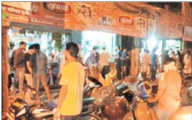
गुना। लंबे लॉकडाउन की घोषणा होते ही सामान खरीदने उमड़ पड़ी भीड़।