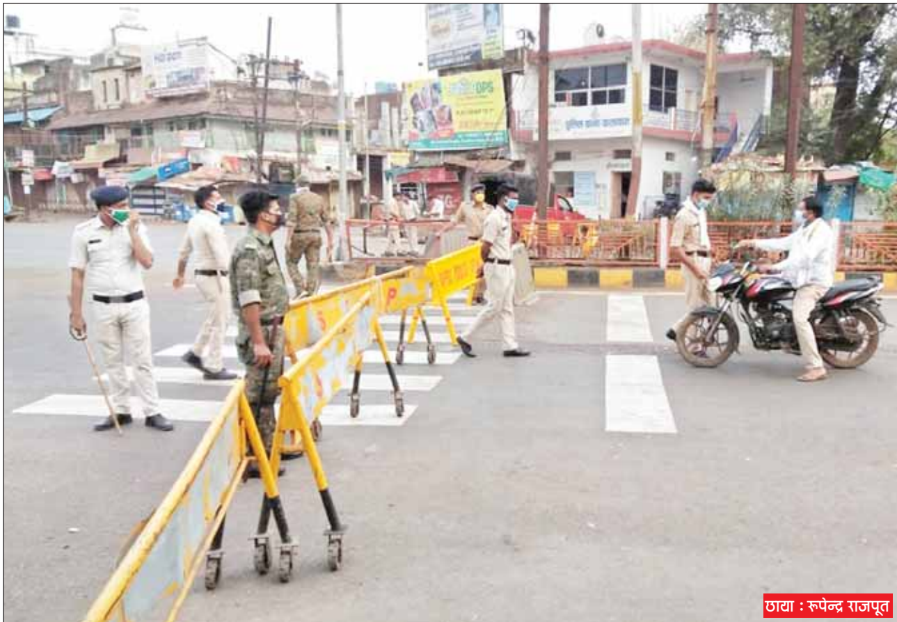
गुना। बुधवार को शहर की ट्रैफिक चौकी के सामने जयस्तंभ चौराहे पर तैनात पुलिसकर्मियों निकल रहे वाहन चालकों को नसीहत देते हुए।

जागरण, गुना। प्रधानमंत्री नरेन्द्र मोदी की अपील पर 21 दिन के लॉकडाउन की अवधि ख़ासी लंबी होने के बाद भी अब कोरोना वायरस के संक्रमण के खतरे को भांपकर आमजन अपने घर में रहने का आदी हो चला है। हालांकि कई ऐसे भी हैं जिन्हें न तो अपनी परवाह है और न अपने परिवार और आम नागरिक की ही कोई चिंता है। ऐसे में पुलिस को लॉकडाउन के दौरान ख़ासी मशक़त करनी पड़ रही है।