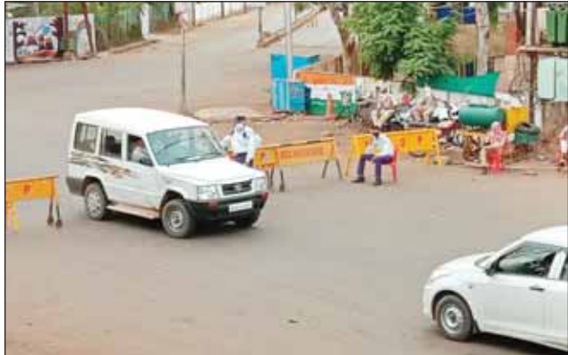
गुना। अंबेडकर चौराहे पर निकलने वाले वाहन चालकों से पूछताछ करती पुलिस